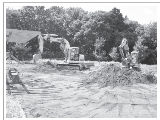
牛久北部地区2号街区公園